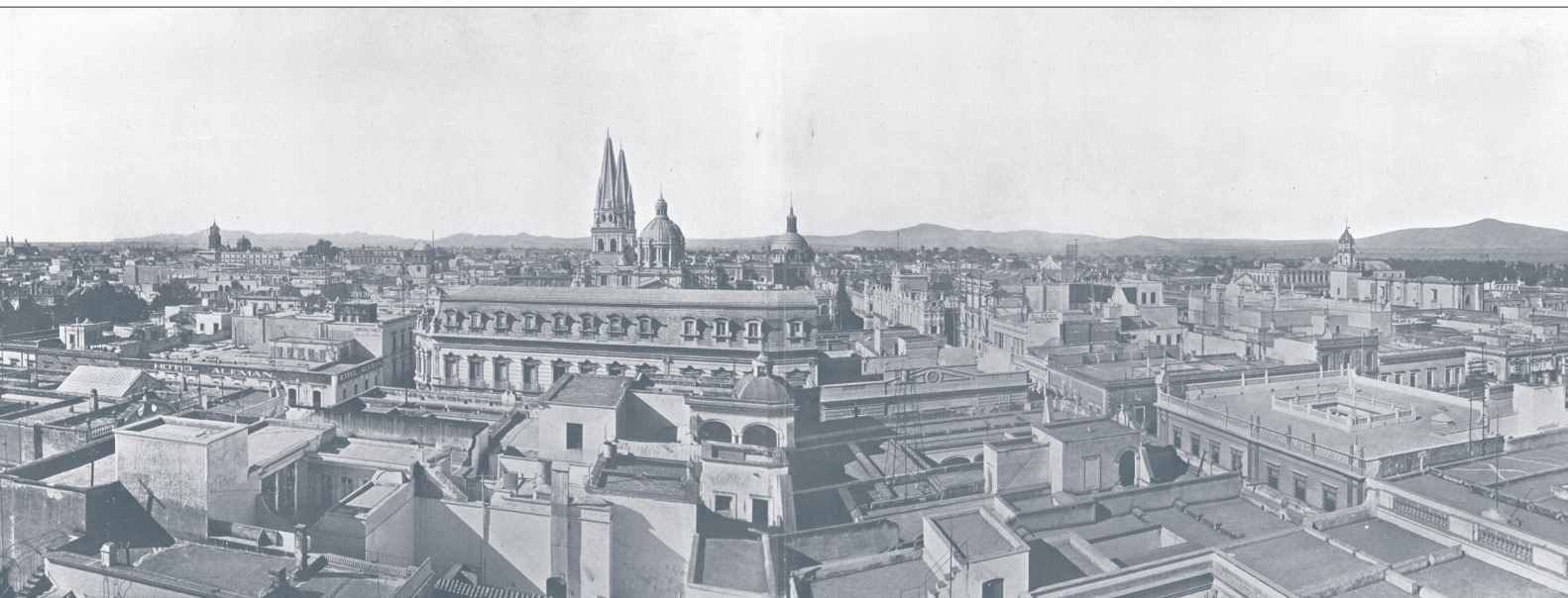
Imagen de marca de Guadalajara y aproximación al Mecanismo de Construcción del Imaginario Neoclásico

El 7 de diciembre de 1896 se celebró en Guadalajara una fiesta en honor del presidente de México, Porfirio Díaz, ofrecida por la Cámara de Comercio. En consonancia con el acontecimiento se eligió un viejo edificio virreinal que con su renovada fachada neoclásica concordaba con el ideario del régimen: El Supremo Tribunal de Justicia, alojado en el antiguo Colegio de Santo Tomás de Aquino que con su templo anexo formaban un conjunto emblemático de Guadalajara.