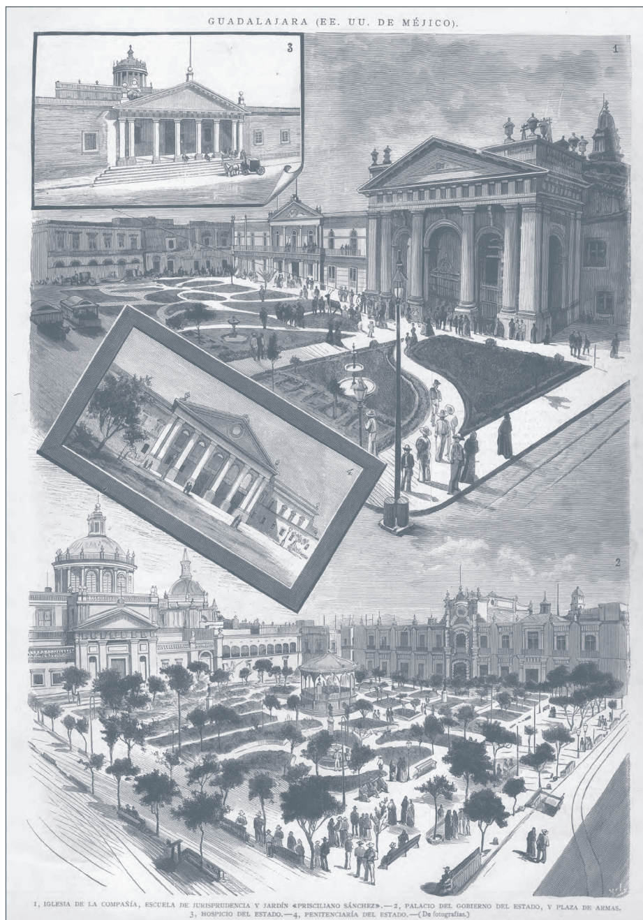
Imagen 3. “Guadalajara (E.E.U.U. México)”, lámina publicada en La Ilustración Española y Americana en el año 1887. Los frontones triangulares revelan la hegemonía otorgada a la estética neoclásica lo que contribuyó a la formación del imaginario tapatío.

país en el que florecía el neoclásico historicista inspirado en las antiguas construcciones griegas y romanas.